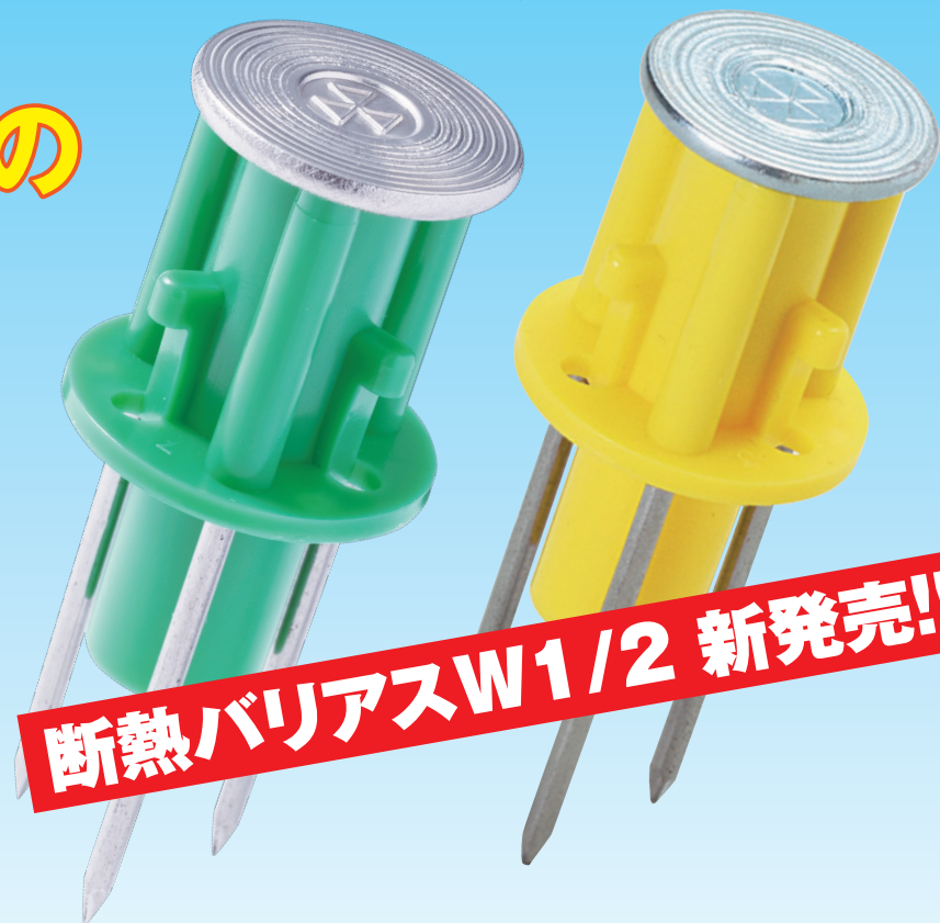
断熱材厚 35~50mmに対応 DV-4035