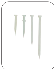
品番表 コードNo.M10119 樹脂釘 ●寸法表 単位 mm